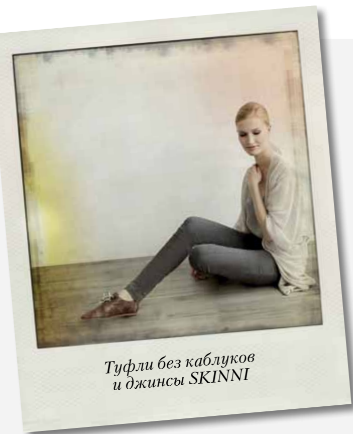
Туфли без каблуков и джинсы SKINNI